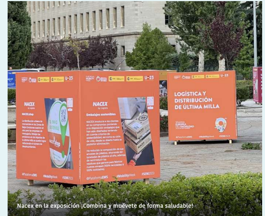
Nacex en la exposición ¡Combina y muévete de forma saludable!

NACEX ha presentado tanto a ciudadanos como a empresas diferentes soluciones para mejorar la calidad del aire en el transporte de última milla.