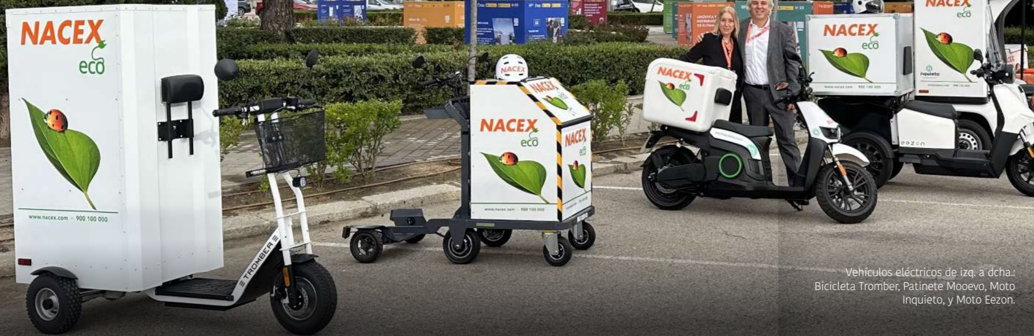
Vehículos eléctricos de izq. a dcha.: Bicicleta Tromber, Patinete Moevo, Moto Inquieto, y Moto Eezon.