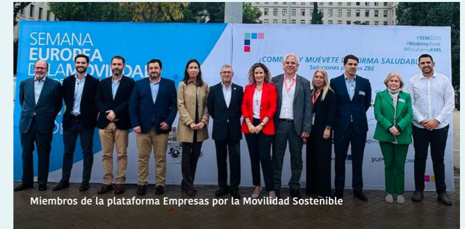
Miembros de la plataforma Empresas por la Movilidad Sostenible