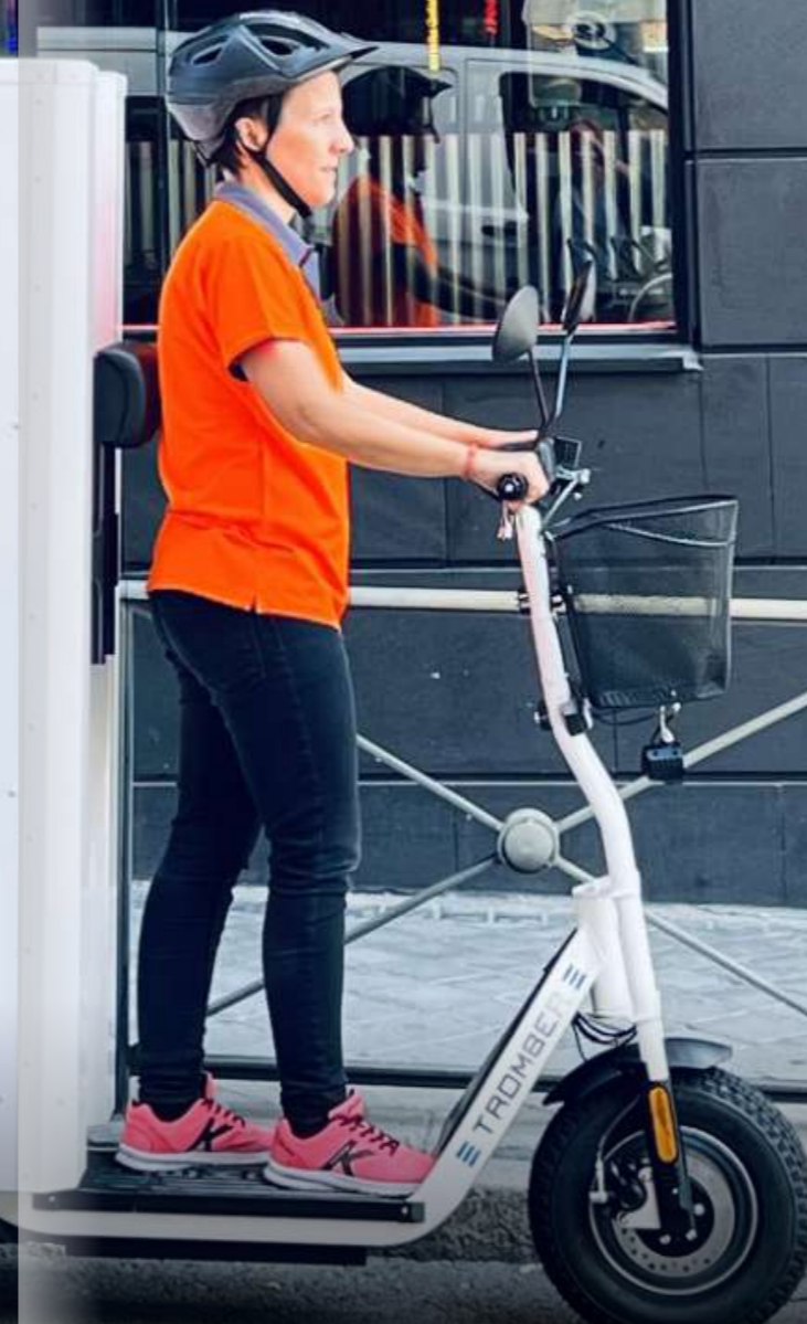
Vehículo eléctrico: Tromber

Entre 2022 y 2023, desde NACEX hemos otorgado un total de 61 ayudas a nuestras franquicias para la adquisición de vehículos (bajas emisiones, eléctricos y 0 emisiones), de las cuales 34 se han destinado a vehículos eléctricos y de 0 emisiones. Todas estas ayudas se han traducido en un ahorro significativo de 42.000 kg de CO2e.